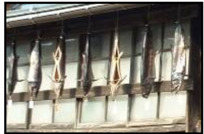
(写真；三面川のサケ)