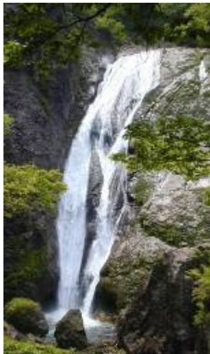
(写真；鈴ヶ滝「日本の滝百選」)

多彩な自然や地域資源等の保全、整備に努めるとともに、生活や産業面等との融合及び活用を図ります。また、魅力あふれる景観形成を促進するため、景観規制の取り組みと景観形成方策を総合的に実施します。