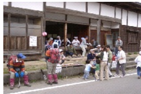
(写真；小俣宿イベントの様子)

前の3つの取り組みのほか、「ふるさと村上」のまちづくりに、市長が必要と認めた取り組みを実施します。