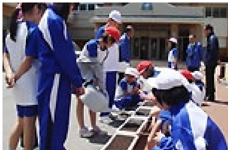
(写真；小学校の活動風景)

次世代を担う子どもを安心して産み育てることができる環境づくりのための環境整備に努めるとともに、保健・医療・福祉を充実させ子どもの健全育成を図ります。