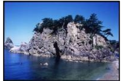
(写真；名勝「笹川流れ」)

村上市は、この美しい自然の保全と、歴史文化を後世に伝えるため、さまざまな施策に積極的に取り組んでいます。