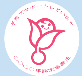
【次世代認定マーク くるみん】

認定企業になると、 次世代認定マーク（愛称：くるみん） を商品等につけることができ、企業のイメージアップや優秀な人材の確保等が期待できます。