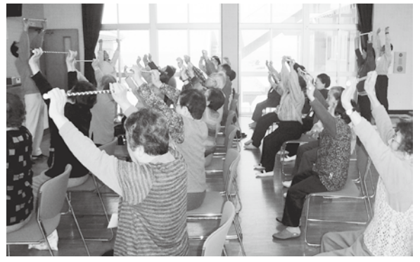
介護支援事業「ゆーとびあ・村上」(あかまつ荘)

答 消費税増税に対処するもので、市民税均等割が非課税の方に1万円が交付され、年金受給者にはさらに