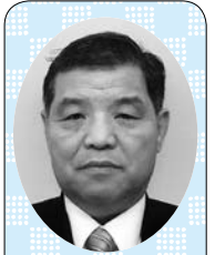
山田 勉 議員