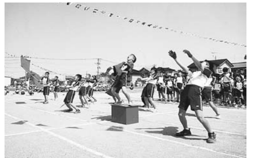
保内小学校の運動会の様子

登校拒否、学力低下やいじめなど子どもたちを取り巻く問題に対し、どのように対応しているのか伺います。