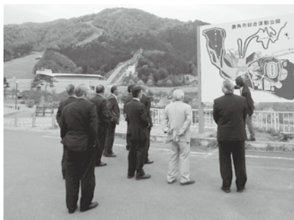
鹿角市総合競技場

小学校で農業を授業科目に取り入れていきます。天候に左右されたり、農業指導者と教師の連携の難さといった課題も多いが、児童が自然の中で食べ物を作る大変さを知ることや食への感謝が生まれ、生きた教育が実証されています。