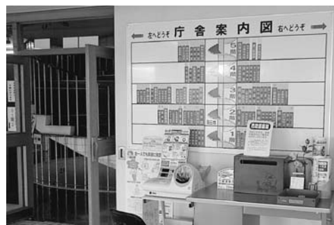
本庁舎内の案内表示板の1つ

問 本庁舎の案内表示が大変分かりにくいとの指摘があります。来庁者にとり、親しみやすい庁舎とするた