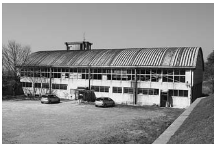
歩夢選手が練習を重ねた 日本海スケートパーク(旧村上市民会館)

問 市教育委員会は、村上第一中学校の生徒である平野歩夢選手のこれまでの努力や今回の快挙をどのように受け止め、市内小中学生にどのような教育的効果を期待していますか。