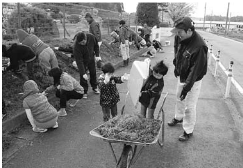
神納東地域まちづくり協議会で取り組んだ「花いっぱいプロジェクト」(神納東小学校校門前)

答 今定例会に「村上市立小・中学校望ましい教育環境整備検討委員会」の条例制定を提案させていただきます。この委員会からの答申を受け、学校統合についての方針を策