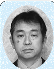
渡辺 昌 議員