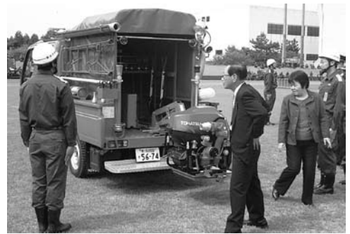
村上市消防団朝日方面隊の春季消防演習の様子

命感とボランティア精神で何とかやっているが、現場の実情は本当に厳しい」と胸の内を明かしています。昨年12月に消防団支援法が成立いたしました。村上市ではどのように支援をしていくのか伺います。 答 市としても消防団を支援するこの法律により、大災害時に消防団の対応力を強化するため26年ぶりに改正された新たな装備品の基準に基づ