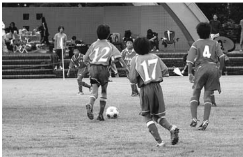
子どもたちのサッカー施設整備が急がれる

潟県北部沖が想定され、第1波の到着まで時間が短いため、遠くまで避難することが困難な状況にあります。そのため、津波避難ビルの指定やタワーの設置が被災の有効手段と考えます。タワーの設置は、規模を含めた必要性を検証しながら本市の全体構想をまとめ、建設用地や財源の確保、地質調査等を進めます。 問 ソチ冬季オリンピックでの平野