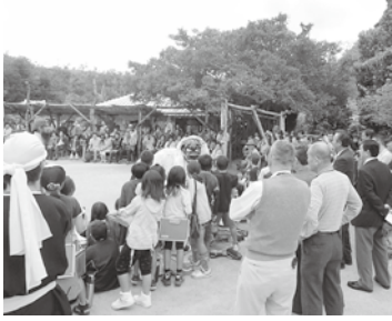
琉球村は地域活性化・文化継承に大きな役割を果たしています

① 伝統琉球民家を移築して経済、琉球文化を紹介し、継承に貢献している観光施設ですが、伝統行事の披露を地域の高齢者に担ってもらうこと