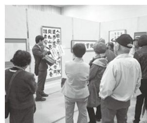
平成25年度の 村上市美術展覧会の様子

めです。文化活動が若干停滞気味であるとの市民のご指摘もあり、予算を一体化し1年間意見交換して平成27年度予算に反映していきたいと考えています。