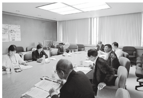
苫小牧市役所での研修の様子

合的に自立へ導くよう取り組んでいます。就労への前段階としてのボランティア活動を重視する「中間的就労」の概念は、本市においても大いに参考にすべきと感じました。