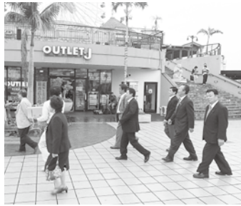
町内外から若者が集まる [美浜タウンリゾートアメリカンビレッジ]

で、生涯学習や地域の活性化に寄与しています。この施設を子どもたちが訪れ、自分の住む地域・文化を知るための教育施設としての役割も果たしており、観光施設だけに終わらせないアイデアは見習うところが大きいと感じました。