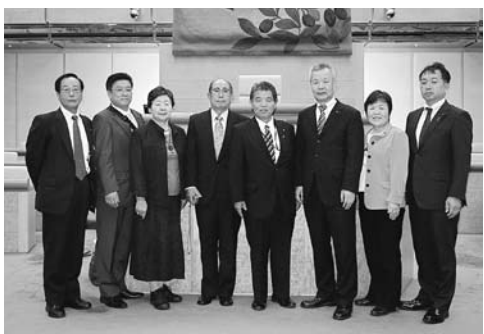
市民厚生常任委員会行政視察 (平成25年10月北海道釧路市)

ですが、議員も行政側も同じ村上市民として村を良いまちにしようという気持ちは同じはず。もっと議