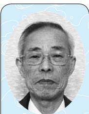
滝沢 武司 議員

にさらなる機能・組織強化を図るための行政経営をどう考えていますか。 答 各支所とも地域振興課と産業建設課の2課体制とし、平成29年度には支所を1つの課として機能するよう移行します。縦割りを排除し横断的な組織体制の確立を図るため、本庁においては、支所の事務の集約化を可能な限り図り、迅速かつ効率的な事務処理体制を目指します。機能強化のためには、本庁・支所における情報の共有を図り、職員の資質・能力の向上が不可欠であり、各種研修を実施し、さまざまな市民ニーズに対応できる職員の育成に努めます。