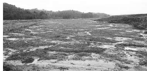
創設非農用地の有効活用を (日下地内)

答 人口減少問題対策委員会では、雇用の確保には企業誘致の他にも、自ら業を起こす、いわゆる「起業」に対する支援策が必要であり、本市の基幹産業である農林水産業を生かした農商工連携および農林漁業の6次産業化を推進することとして、平成27年度から官民一体となった計画づくりに向けた準備作業を進めていきます。