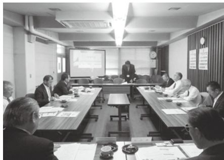
喜多方市小学校農業科

本市議会では、行政の諸課題の解決、事務事業の比較と調査、政策研究等のため視察目的を定め自治体等を訪問し、先進的な事例の実情を直接把握して学ぶ行政視察を行っています。 平成25年度は、10月から11月にかけて各常任委員会において行いました。