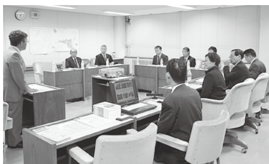
釧路市役所での研修の様子

小学校で農業を授業科目に取り入れていきます。天候に左右されたり、農業指導者と教師の連携の難さといった課題も多いが、児童が自然の中で食べ物を作る大変さを知ることや食への感謝が生まれ、生きた教育が実証されています。