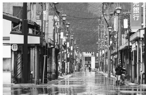
待たれる大町・小町の町並み整備

織再編を見据え、各支所の4課体制を2課体制に移行します。そこで今後の村上市行政が住民サービス向上