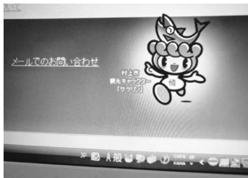
村上市のHPからメールで問い合わせできます