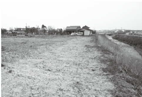
未完成の道の駅神林

挙げられます。道の駅神林は、未完成です。調整池も含む道の駅整備を国土交通省にお願いしたらいかがで