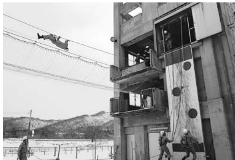
市民を守る消防署員の訓練

問 厚生連は当初に土地の無償貸与と建設費の財政支援を要望したと伺っていますが、市の示した支援は用