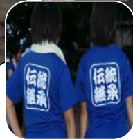
午後8時頃北新保と長松の屋台がすれ違います。