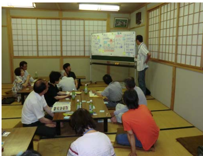
7月24日第2回花いっぱい事業検討部会の様子

終わったら、みんなでトン汁とおにぎりで昼食会、そして表彰式という流れを計画しています。