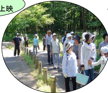
お幕場散歩の様子。久しぶりにお会いする人が多いそうです。

塩谷では、お幕場散歩を4月から月1回40人くらいの参加で行っています。「アラッ、久しぶりだね～」、「あなたどなた？」と、気軽に参加し、気軽に話しながら散歩しています。また、海岸の現状を訴えるDVDの上映会が8月4・5日に開かれました。