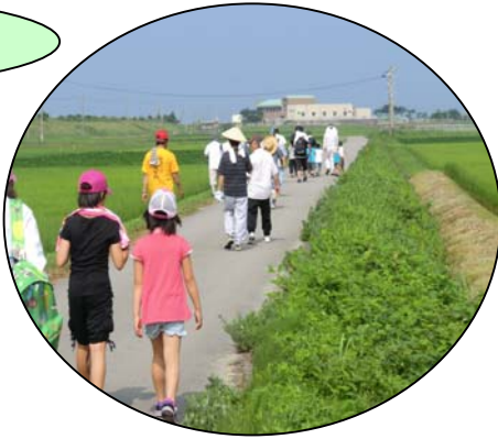
マイペースで6キロの行程を完歩

午前9時過ぎ出発。ウォーキングに参加したのは、子ども15名を含め40名、また児童公園ではゲートボールで健康づくりをしました。例年より多い60名ほどが参加し、久しぶりに逢った人と語り合い、楽しい1日となりました。