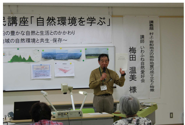
自然環境を学ぶ講座（平成26年度）