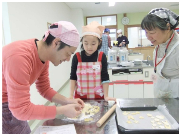
パパと一緒にクッキー作り

ホットケーキミックスを使ったクッキー生地を星や花、ハート、ドラえもんなど思い思いの形にしてお菓子づくりを楽しみました。こんがり焼きあげたクッキーをかわいくラッ