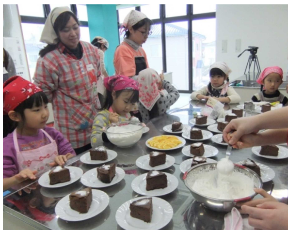
美味しいガトーショコラできあがり

3月14日（土）には、「ホワイトデー編」としてママへ贈るクッキー作りをしました。