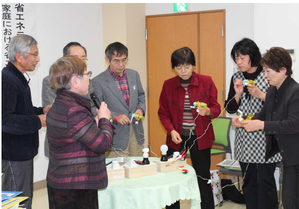
環境エネルギー講座（平成26年度）