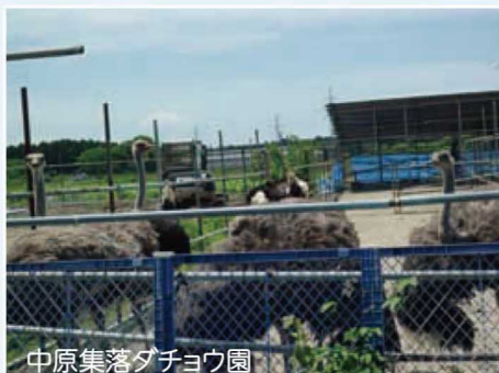
中原集落ダチョウ園