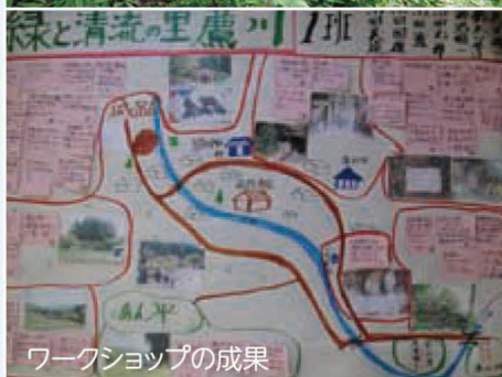
ワークショップの成果