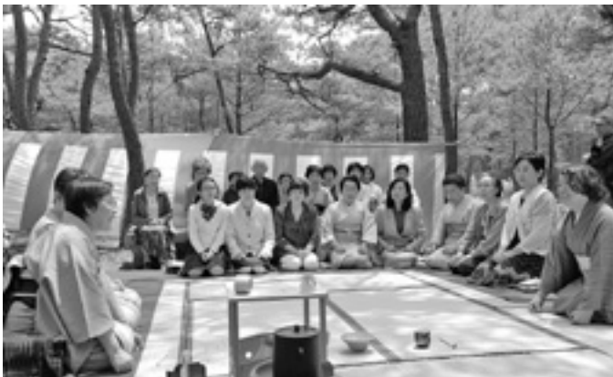
昨年のお幕場茶会

※市役所窓口延長日…本庁市民課は毎週火・木曜日、各支所地域振興課は毎月第2・第4木曜日に実施(祝日を除く)。延長時間は午後5時15分～7時