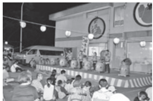
昨年の瀬波温泉納涼祭