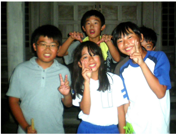
神社の前で自撮り写真撮影

夕食のアルミ缶炊飯は、飯ごうで炊くより時間はかかりましたが、350mlのアルミ缶で1合のご飯がうまく炊けました。