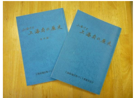
↑ふるさと上海府の歴史（通史編）外観