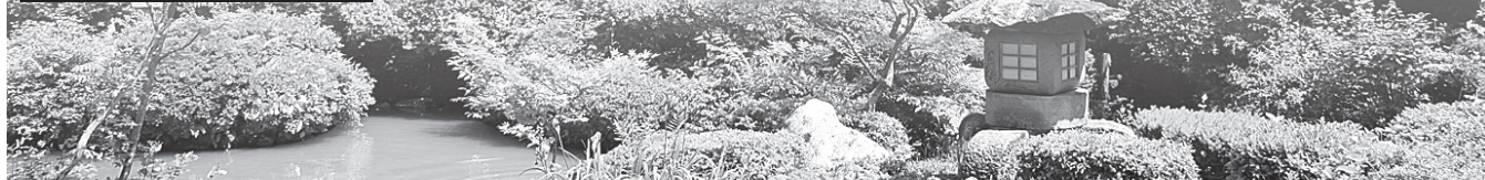
園 村上市観光協会 (☎53-2258)

と き 5月1日(日)～31日(火) 午前9時～午後5時 ※公開日・公開時間は各公開場所により異なります ところ 旧城下町地区一帯 内 容 町屋・寺・武家地区の庭・花・盆栽・山野草などを無料公開します。 ※同時開催イベント「春の庭園公開」も次の場所で開催します 普濟寺(大場沢1847)、ふくろうの森(天神岡381-1) 主 催 城下町村上 庭の会