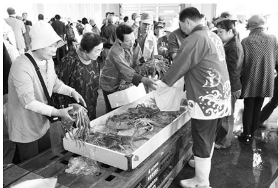
昨年のさかなまつりin岩船港