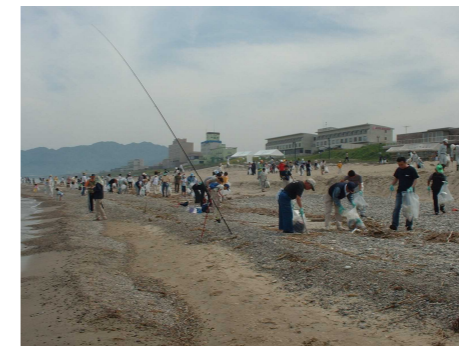
ボランティアによるクリーン作戦