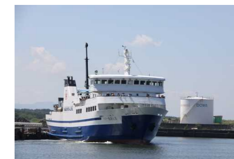
写真：粟島への定期航路(粟島汽船)