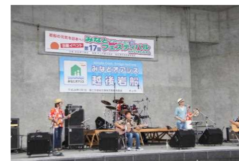
写真：港フェスティバル