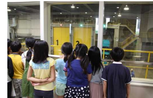
小学生のごみ処理場見学