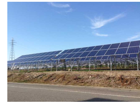
ソーラーパネルによる発電