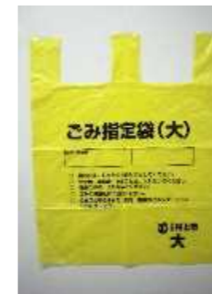
村上市指定ごみ袋