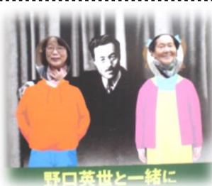
野口英世と一緒に