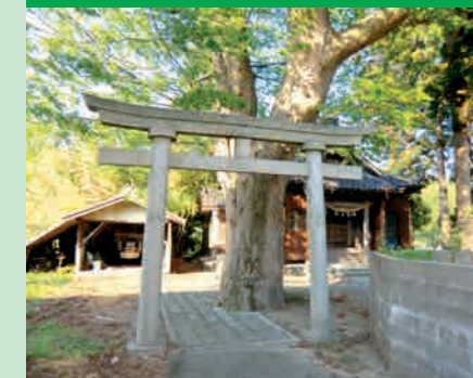
川部大山祇神社の大櫓

今年度は、地域交流事業を始め、地域活性化に積極的に取り組む集落への支援、これからのまちづくりを学ぶための研修会を開催しました。また、集落の課題解決に向けての取り組みや平林小学校との連携にも取り組みました。