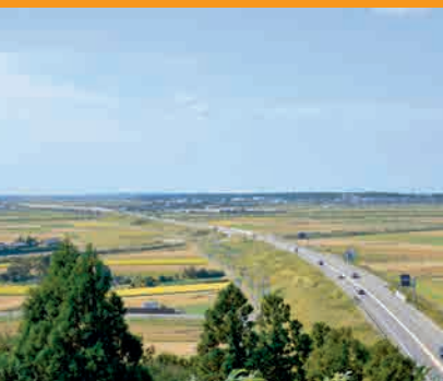
山元遺跡からの眺め

地域全体の交流を促進するため地域の運動会や地元の軽トラ市「神納東ふれあい市」を開催しました。今後も活気と魅力あふれる住みよい地域づくりのため、各種事業に取り組んでまいります。