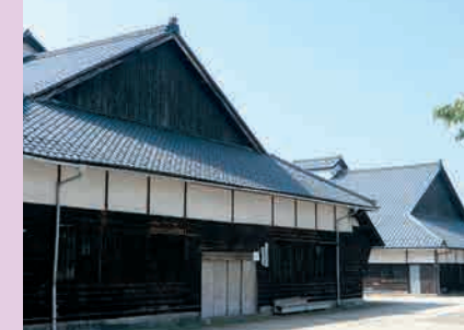
JAかみはやし岩船駅前倉庫

また、地域全体の事業では、10月にミニ体育祭、2月にももちつき大会を実施したほか、西神納小学校やPTAの皆さんと連携を図り、西神納小学校文化祭にも参画いたしました。