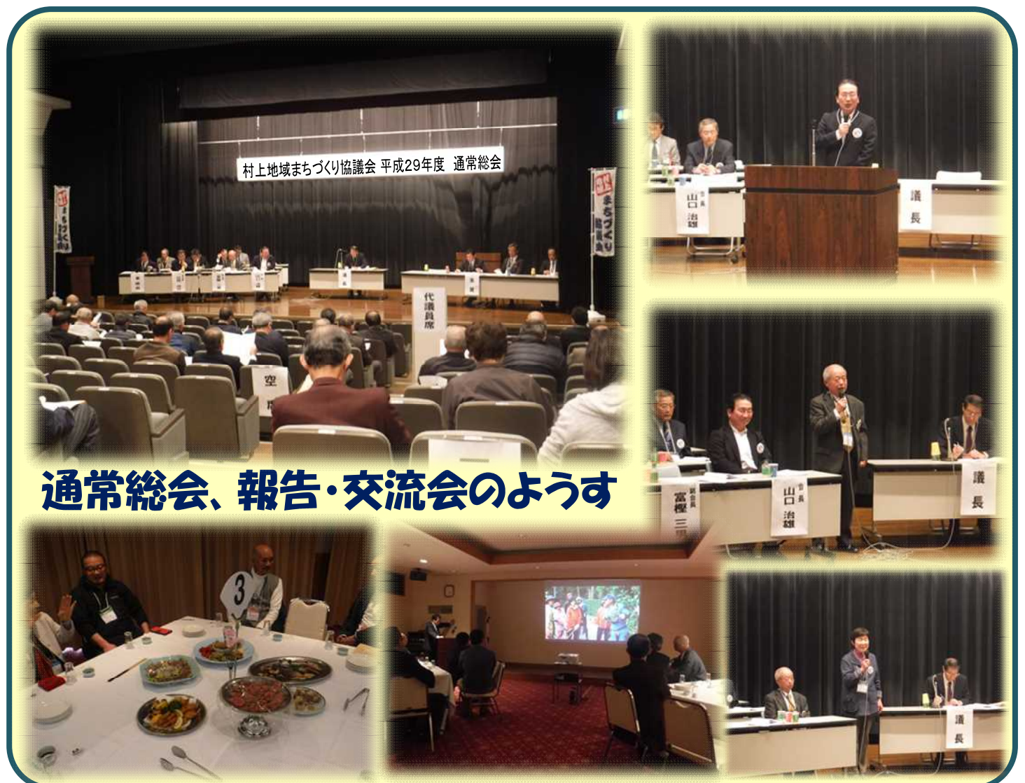
通常総会、報告・交流会のようす

6年目となった協議会の活動は、新しいまちづくり計画と役員体制で、新しいスタートを切ることにになりました。今後も、村上地域まちづくり協議会の発展のために、より一層のご理解とご協力、そして事業への参加をお願い申し上げます。