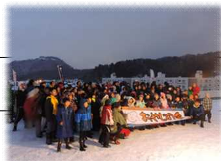
小学校おやじの会 雪灯籠まつり