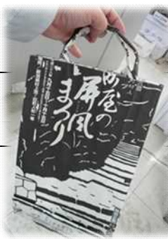
“思い出とおもてなしをお持ち帰りいただける”手提げ袋(愛称:村紙バッグ)