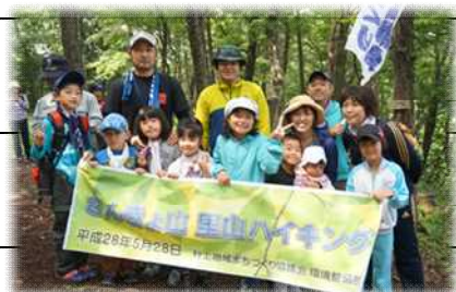
さんきょ山里山ハイキング