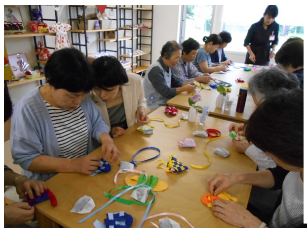
ハーブを使ったサシ作り

学習してきました。2回目はハーブを使った簡単おつまみづくりを、心地よいハーブの香りに包まれながら行いました。参加者からは、「地域の活動を知ることができて良かった」「ハーブを日常生活の中でも取り入れたい」などの感想が寄せられました。これからも地元の産業や歴史、文化を学び、村上の良さを発見していきたいと思います。