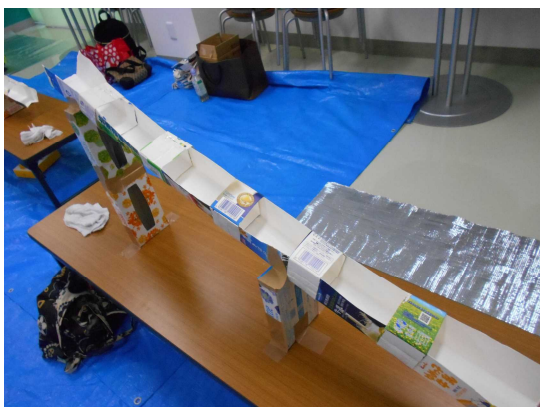
牛乳パックの流しそうめん器