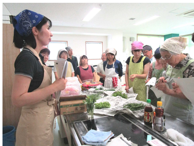
ハーブを使ったおつまみ作り

1回目はあらかわ総合運動公園にあるラベンダー畑を見学後、荒川地区で取り組んでいるラベンダーを使った町おこしの活動について