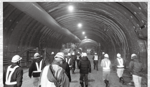
▲トンネル工事が進む「朝日温海道路」(大須戸地内)

ご利用いただけるよう取り組みを進めております。また、日本海沿岸東北自動車道、国道7号「朝日温海道路」では、大須戸地内でのトンネル工事が着手されております。道の駅「朝日」の拡充計画と併せ、一日も早くミッシングリンク(非連続性)が解消されることで、東北エリアと関東・北陸エリアを繋ぐゲートウェイとしての機能を發揮し、経済的効果が生み出されていくよう、取り組みを進めてまいります。