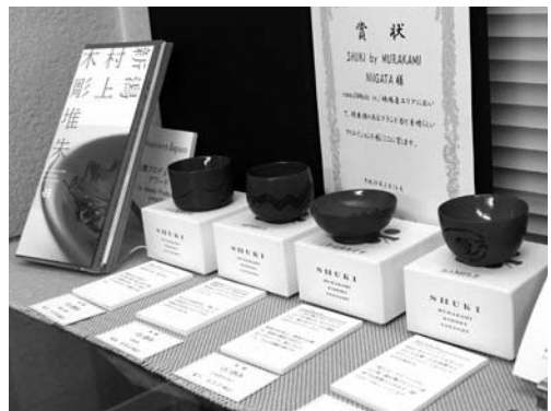
▲普段使いできる、ぐい呑みの「朱器の酒器」

現代のクリエイター4人と職人のコラボレーションから生まれた、普段使いの漆器ブランド「朱器」。気持ちを晴れやかに演出する朱色を生かしたデザインモチーフとなっています。