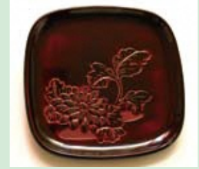
しゆだめぬり 朱溜塗

堆朱と同様に伝統的な技法で、中塗りから黒漆を用いて上塗りし、黒呂色漆にて塗り上げます。