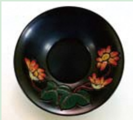
いろうるしぬり 色漆塗

堆朱の工程のつや消し後、さらに溜漆を2、3回塗り重ねて丁寧に研磨して仕上げる技法。