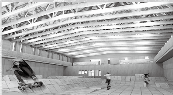
▲（仮称）村上市スケートパーク イメージ図

月「やさしさと輝きに満ちた笑顔のまち村上」をスローガンに「第2次村上市総合計画」がスタートいたしました。10年後、20年後、そして30年後の未来を担う子どもたち一人ひとりが、夢や希望をもって活躍できる村上市となるよう、取り組みを進めてまいります。