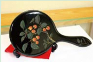
さんさいぼり 三彩彫

上塗りに数色の色漆を用いて、鮮やかに塗り上げる技法。これにより色彩豊かな表現が可能となりました。