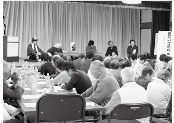
▲一人暮らし高齢者給食サービス会での寸劇

●問い合わせ 介護高齢課地域包括支援センター ☎53-2111 (内線365) または各支所地域振興課地域福祉室