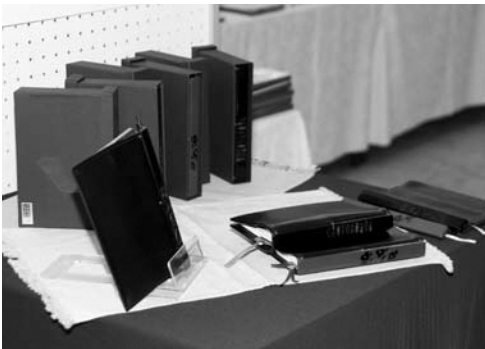
▲背表紙が村上木彫堆朱となっているKOITTEN(紅一点)

これまでも「地球儀」や「時計」などを製作。昨年には実際の試作品から商品化されたブックカバー「KOITTEN(紅一点)」が誕生しています。