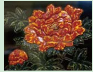
きんまぬり 金磨塗

彫漆とも言い、彫刻のない木地に朱・黄・緑の三色を塗り重ね、最後に黒を塗り上げてから表面を彫り、色を出す技法。