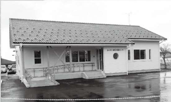
▲昨年7月に開設したあらかわ病児保育センター

また、厚生連村上総合病院の移転新築につきましても、当圏域の中心的医療を担う重要な医療資源でありますので、平成32年の開院に向け支援してまいります。加えて、医療を担う人材の確保も喫緊の課題であり、昨年9月には、本市独自の「医学生修学資金貸与制度」を創設いたしました。中学生・高校生を対象とした医師体験見学会などでは、医療分野での活躍を志す子どもたちが熱心に参加してくださり、将来の地域医療を担う人材として大いに期待するところでもあります。 そして、子