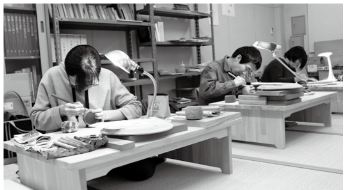
▲彫りの練習に励む3人

—将来の夢を聞かせてください。 大葉田 村上木彫堆朱の伝統は継承していかなければならないと思います。自分がそれにな