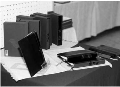
▲背表紙が村上木彫堆朱となっているKOITTEN(紅一点)

これまでも「地球儀」や「時計」などを製作。昨年には実際の試作品から商品化されたブックカバー「KOITTEN(紅一点)」が誕生しています。