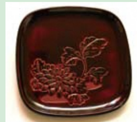
しゅだめぬり 朱溜塗

堆朱と同様に伝統的な技法で、中塗りから黒漆を用いて上塗りし、黒呂色漆にて塗り上げます。