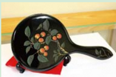
さんさいぼり 三彩彫

上塗りに数色の色漆を用いて、鮮やかに塗り上げる技法。これにより色彩豊かな表現が可能となりました。