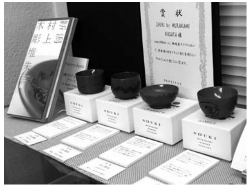
▲普段使いできる、ぐい呑みの「朱器の酒器」

現代のクリエイター4人と職人のコラボレーションから生まれた、普段使いの漆器ブランド「朱器」。気持ちを晴れやかに演出する朱色を生かしたデザインモチーフとなっています。