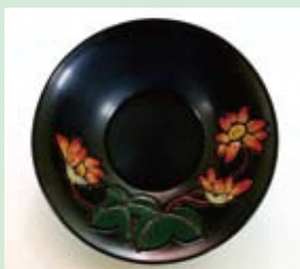
いろりぬり 色漆塗

堆朱の工程のつや消し後、さらに溜漆を2、3回塗り重ねて丁寧に研磨して仕上げる技法。