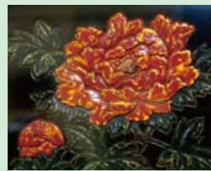
きんまぬり 金磨塗

彫漆とも言い、彫刻のない木地に朱・黄・緑の三色を塗り重ね、最後に黒を塗り上げてから表面を彫り、色を出す技法。