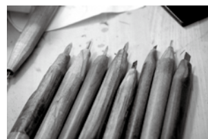
▲彫刻刀の柄は、すべて手作り

育成中の3人に向けて「3年間頑張つてほしい。この業界を引っ張っていく世代なのだから、私の技術を惜しみなく伝えたい。今後は若い世代に活躍してもらわないといけないので、若い人たちの感覚も取り入れて、村上木彫堆朱を進化させていってほしいですね」とエールを送ります。