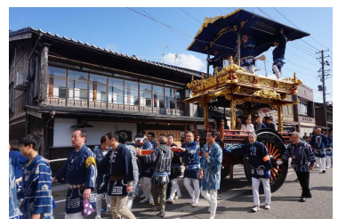
天気が良ければ、今年も「トキ屋台」が春の城下町を巡行します。