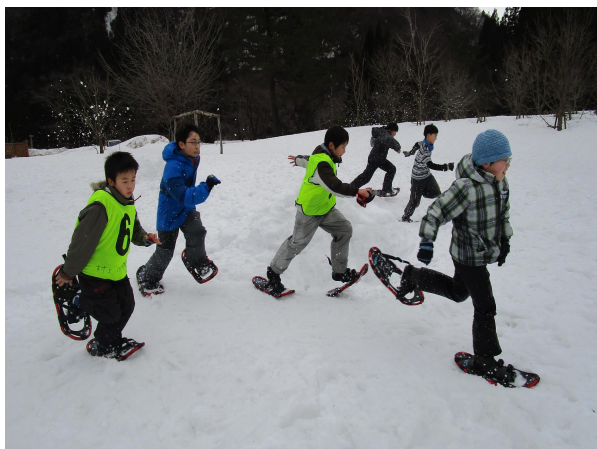
スノーシューでダッシュ

ほんのりとした春の香を感じながら、この時期にしかできない貴重な体験を思う存分楽しんだ一日となりました。