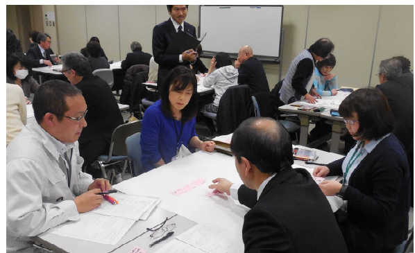
担当地区を越えて思いを共有

容をふまえ、各地域での課題や提案について協議しました。ここでは、各地区での課題や実践している活動などの情報の共有化を図るとともに、グループワークの運営手法を学びました。