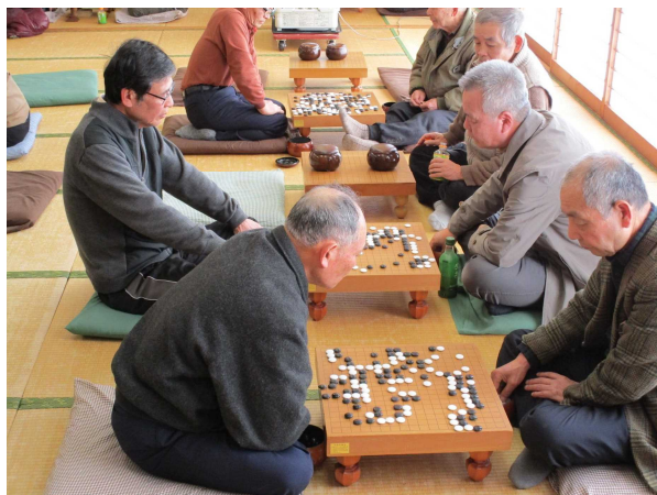
盤上に広がる白と黒の陣取り合戦