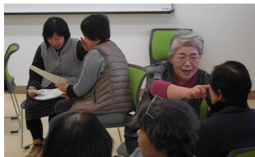
楽しい学習会になりました

参加者からは「ひととき子どもに返らせていただきました」「とてもやさしく温かい気持ちになった。早速実践してみようと思う」などの声が寄せられました。