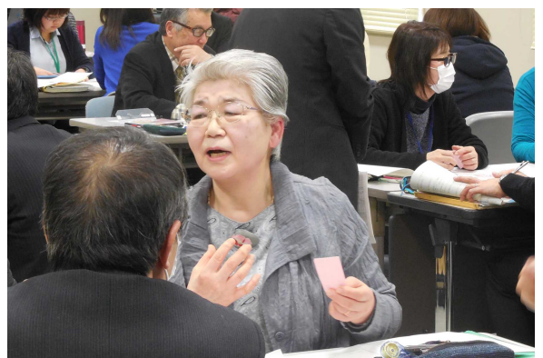
ワークショップのようす

全体を通して普段は離れて公民館活動を行っている各役職員の交流が深められ、それぞれが抱える地域課題を共有することができました。この研修で学んだ成果を各地域での公民館活動に活かし、村上市の教育理念である「郷育のまち・村上」の達成に向けた取組みを進めていきます。