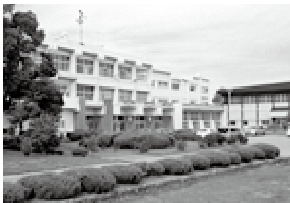
エアコン設置を望む市内の学校

問 懇談会」でもエアコンの設置要望が強く提案された。また、ある学校では3階での授業が暑さのため困難なことから、エアコンが設置してある1階の教室を交代で使用したとのことである。「国の動向を注視しながら検討する」では考えが甘いのではないか。再度、エアコンの設置について市民のニーズに應えるように早急に検討すべきでないか。