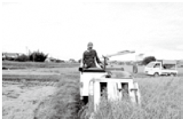
強い農業へ取り組みを