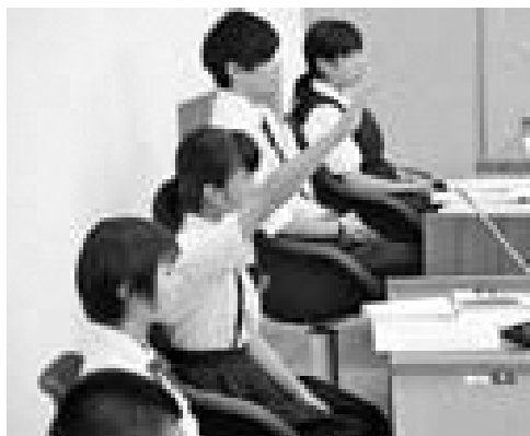
挙手をして議長の許可を得て質問します