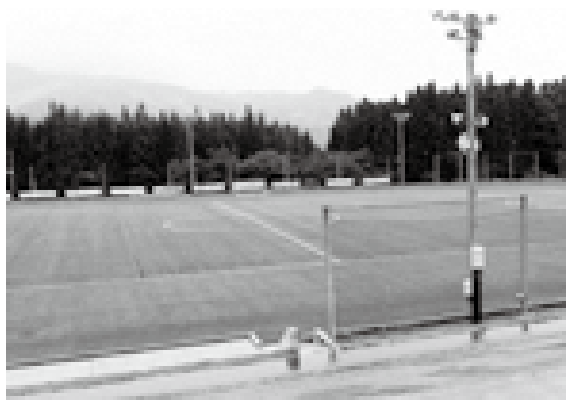
南魚沼市の多目的人工芝グラウンド

問 パルパーク神林に整備予定の多目的人工芝グラウンドについて、進捗状況を伺う。 答 人工芝グラウンドの整備については、市サッカー協会・市スポーツ少年団など、利用団体との話し合いを重ね、神林多目的グラウンドを人工芝グラウンドに改修するとともに、統合後の平林中学校グラウンドを少年野球用のグラウンドとして整備する方向で一定の合意形成を得ているが、事業化には至っていない。 問 数年前に関係団体や多くの市民から署名とともに要望がある人工芝グラウンドの事業化が進まない中で、