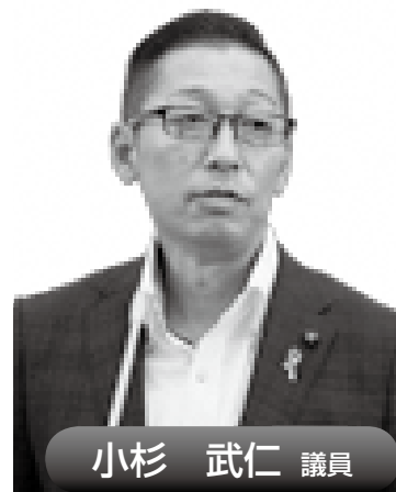
小杉 武仁 議員

問 28年第4回定例会の一般質問にて、予防医療の観点から胃がんハイリスク（ピロリ菌）検査を市の検診に導入するよう提案した 答 検査の重要性や医療機関の紹介を市報とホームページを活用して周知を図るとともに、胃内視鏡検診実施に向けた検討会でも専門医から意見をいただき議論を深めてきた。 また、胃の病気に関する講演会を開催するなど、ピロリ菌を含めた胃がん予防に対する取り組みを段階的に進めている。 現在の状況としては本市における胃がん死亡率の減少が見られず、現行の胃がん検診率も停滞しているの