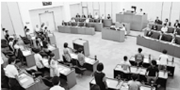
「ふるさと村上のまちづくりをともに考える決議」採決の瞬間。 起立全員により可決され、こども議会を閉会しました