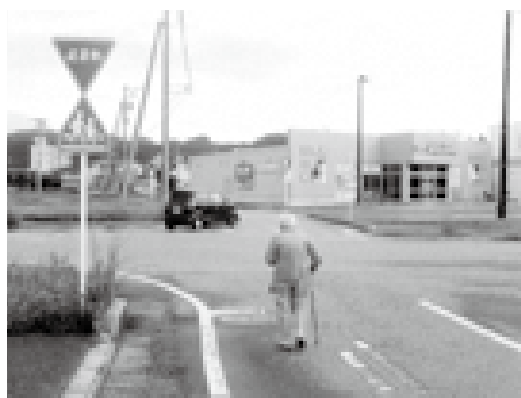
交通量の増加が予想される交差点付近

増加が想定されることから、安全確保のため信号機等の交通安全施設について、今後も公安委員会への要望を行っていく。