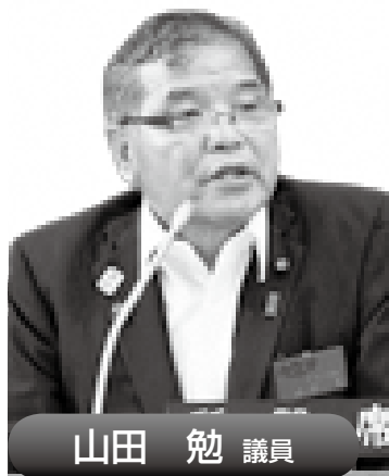
山田 勉 議員