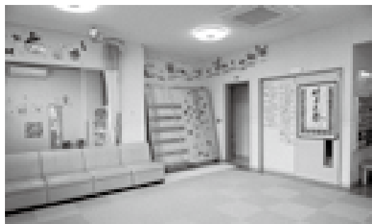
市内にある放課後等デイサービスセンター