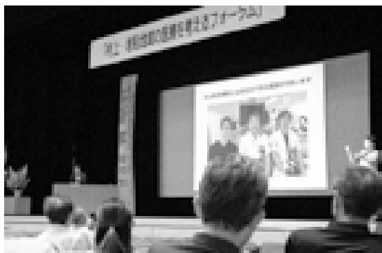
国民の2人に1人が“がん”を発症 (村上・岩船地域の医療を考えるフォーラムにて)

で、胃がん発生リスクの軽減と死亡率の減少を目的に地元医師会や専門医から協力をいただきながら、検診時の胃がんハイリスク検診の実施に向けた調整を進めることとしている。 問 中学生を対象として、学校の定期健診でピロリ菌抗体検査を実施する考えはないか。 答 長岡市と糸魚川市で中学生の検査を実施しているが、本市では実施状況の確認や、検診機関に対する調査を実施してきた。しかし、学校でのピロリ菌検査の事例がない状況である。また、生徒が検査に不安を感じることも考えられるため、今後は、がん教育の実施率を高め、がんの知識習得と理解を得ながら、ピロリ菌抗体検査の実施を検討していく。