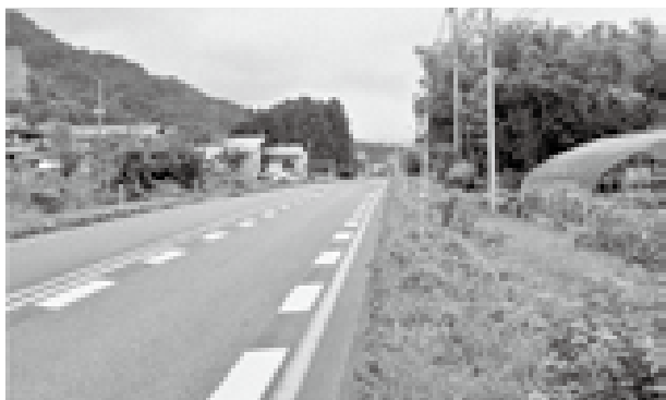
国道7号檜原地区交通安全対策の新規事業として事業化が決まった歩道予定地

答 国では、通学路に指定されている猿沢・檜原間で通学児童等歩行者の安全・安心の確保を目的に、本年度に国道7号檜原地区交通安全対策を新規事業として事業化している。事業区間は、道の駅「朝日」からエコパーク村上までの延長2kmであり、本年度は調査設計を行う予定。 問 小・中学校の教室環境をどう捉え、猛暑の対応策について伺う。 答 今年の夏は、連日熱中症に対する警戒が出される異常気象となり、