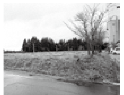
神林工業団地の市所有地残り2区画

いこの話も出てきており、成果は出つつあると考えています。また、現在残っている工業団地は、山北地区府屋は2