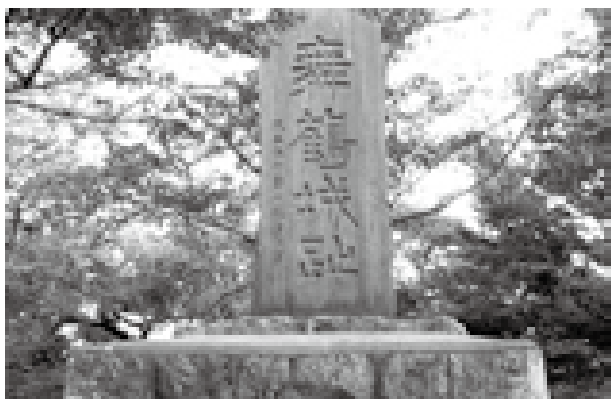
子どもから大人まで集えるお城山に

号となり、村上市ゆかりの雅子さまが皇后陛下になられる年であることから、事業の施行日を決定したものと聞いている。「お城山の日」の制定は市民の一体感を育む方法として研究していきたい。 問 村上市独自で来年度に向けたエアコン設置の準備、猛暑対策を進めるべきと思うが。 答 本年4月1日現在、普通教室で2・6%、特別教室で11・0%、全教室では7・7%と低い状況になっている。エアコンの設置については国の動向を注視しながら検討していく。