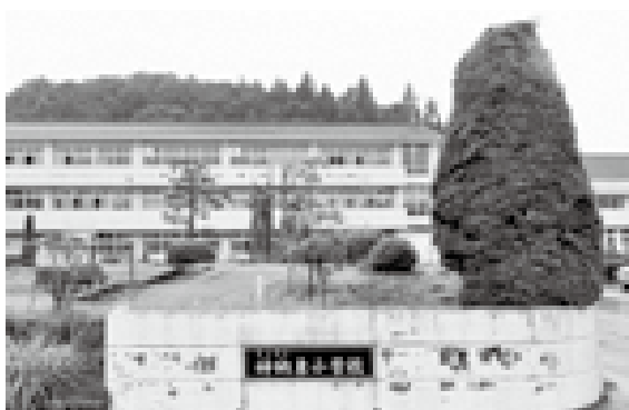
子育て支援施設としての有効利用が検討されている神納東小学校

答 今ある施設財産を有効利用していく意味で重要なポイントであり、しっかりと取り組んでいかなければならないので検討させていただく。