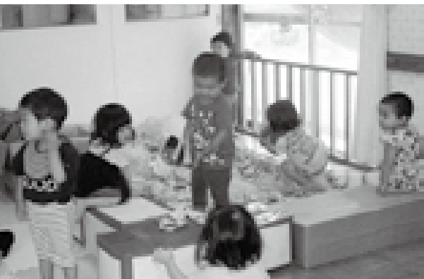
外は猛暑。全部の保育園にエアコン設置を

問 高齢者世帯へのエアコン設置は、のり保育園の2園が未設置である。のり保育園、遊戯室は向ヶ丘保育園、みのり保育園、山居町保育園