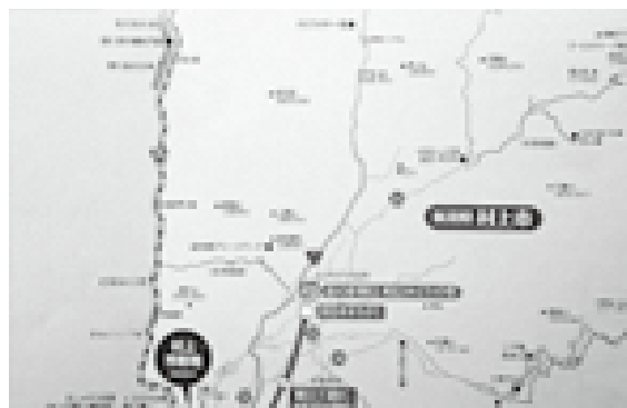
観光パンフレットから「道の駅笹川流れ夕日会館」が削除された(写真左上)

充できる内容があるのではないかなど、スタッフ全員での検証を重ねながら、観光で訪れる方や地域の皆さまに愛される施設を目指していきたいと考えている。