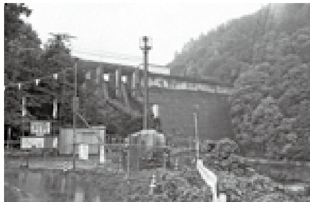
定期点検中の三面ダム

問 三面川水系三面川洪水浸水想定区域図（想定最大規模）が公表された。洪水浸水想定区域の住民周知が必要ではないか。 答 本年度末までには新たなハザードマップが完成する見込みであり、説明会を行う。 問 駅西に移転予定の厚生連村上総合病院は、災害拠点病院として最大規模の洪水でも機能するのか。 答 厚生連では、関係機関と連携の上、対応を検討していくと聞いている。 問 合併前にラスパイレス指数で差