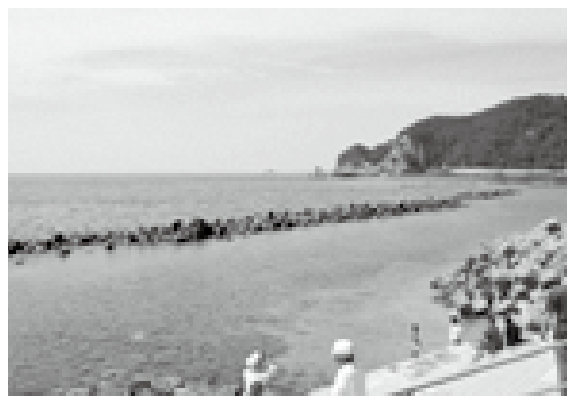
離岸堤設置の状況(桑川)

委託として、8月30日に業者が決定した。1月から3月にプランニングを行う流れで調整をしているところである。また、外部監査制度の必要性を感じることから導入について検討したい。