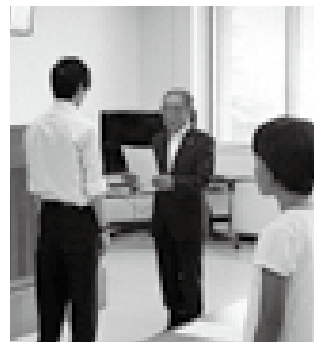
開会式では 村上市選挙管理委員長から 「選任書」を授与