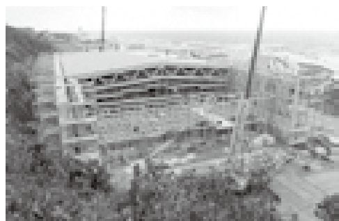
スケートパークの建設状況 (9月末撮影)

問 対象となる契約変更工事の一部がすでに完了しているため、議案そのものが今の状態では問題があるのでは。