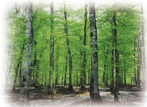
村上市ブナ原生林

大切なさけを後世に引き継ぐために、私たちに何ができるでしょうか？さけを守るためには、「豊かな川」、「豊かな海」、そしてそれを生み出す「豊かな森林」が必要です。森林はさけが生まれ育つ水を作り出し、海に栄養分を供給し海に下ったさけの鮭を作り出します。私たちは先人の築きあげてきた「さけの川」を未来の子供たちに引き継ぐため「さけの森林」をつくっています。いつまでも、三面川が豊かなさけの川であることを祈って。