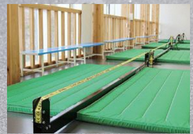
▲スラックライン (2階) 幅5センチメートル、長さ4メートルのライン上で歩いたり、ジャンプしたりさまざまなポーズをとったりするスポーツです。高さが30センチメートルと50センチメートルの2種類があります。