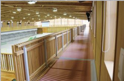
▲ランニングコース(2階)