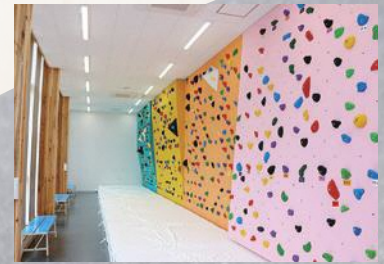
▲ボルダリング (1階) 壁に人工的に作られた突起物を使いながら高さ約4メートル以上に登るスポーツです。

※利用日 (利用日が引き続き2日以上の場合は、その初日) の1か月前から10日前までに利用許可申請書を提出して、許可を受けてください