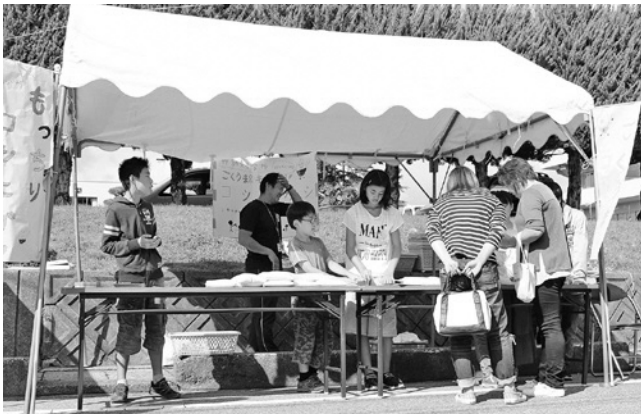
▲小学生のお米販売

市ではこれまで六斎市に活気を取り戻すため、フリーマーケットの開催やパンフレットの製作のほか、買い物客の利便性向上のためのショッピングカートの導入、新規出店の呼び掛け、まちづくり協議会と協働で制作したのぼり旗や店名を記した木札の設置などに取り組んできました。現在も村上市場組合などの関係者と連携し、市場の活性化策を検討しています。