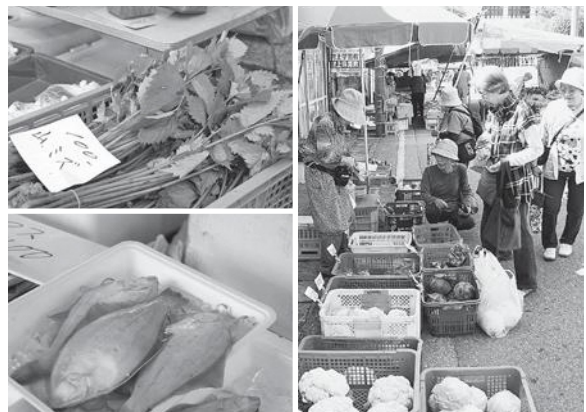
▲新鮮な食材がたくさんあります