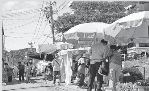
▲にぎわいを見せる市場(6月12日)