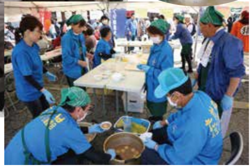
スタッフも大忙し！