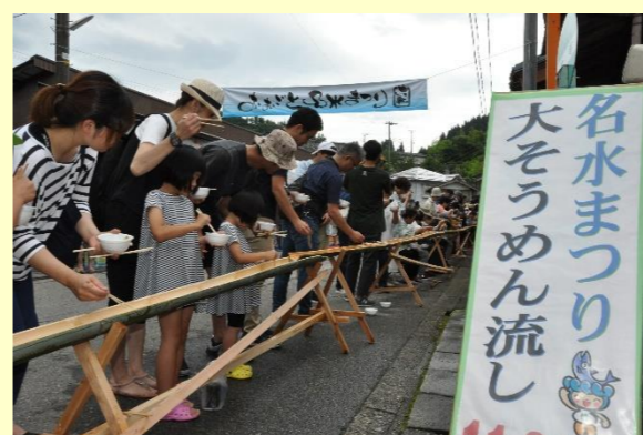
助成金を活用した「おごと名水まつり」

①人材バンク 地域で抱える課題を、人とのつながりを活かして解決に結び付けるための取り組みです。 まずは、越沢集落をモデルとして、集落アンケートから出た課題を解決するためにワークショップを重ねているところです。 この事例を基にして、他の集落にも活用できる仕組みを作りたいと考えています。