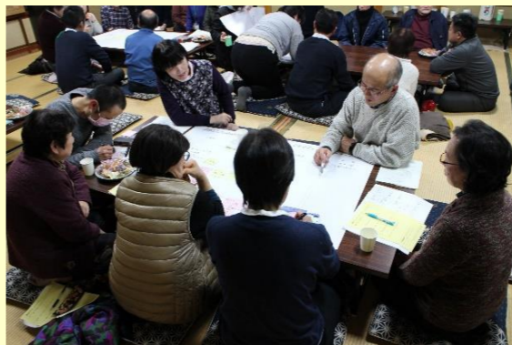
越沢集落では、これまで3回の懇談会を実施

①人材バンク 地域で抱える課題を、人とのつながりを活かして解決に結び付けるための取り組みです。 まずは、越沢集落をモデルとして、集落アンケートから出た課題を解決するためにワークショップを重ねているところです。 この事例を基にして、他の集落にも活用できる仕組みを作りたいと考えています。