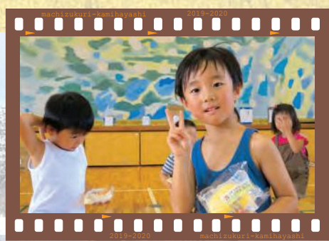
film10 西神納三二体育祭 運動会の人気種目「パン食い競争」での一コマ。無事にパンが取れまして、ホッと一息のところカメラを向けてみました。「パンが取れて良かったあ!」ってことで、安堵のピース!