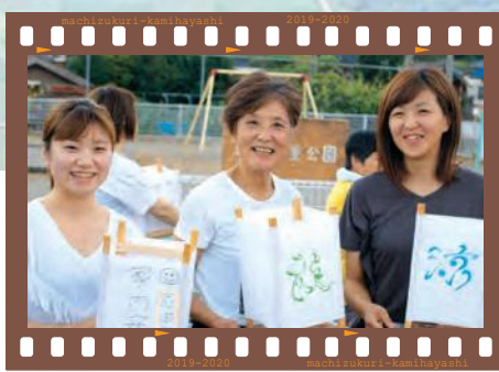
film05 殿岡灯籠流し 平成24年に50年ぶりに復活した「灯籠流し」。8月15日の夕方、各自がこの日のために思いを込めて作った灯籠を持って、石川沿いに集まります。流す前の灯籠を持ちながら、カメラに向かって「にっこりスマイル」を、いただきました!