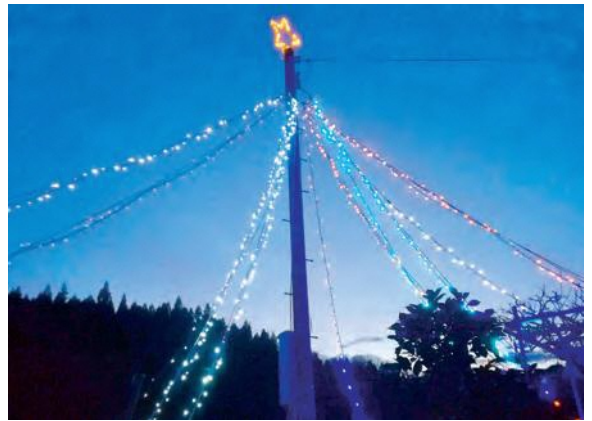
河内集落イルミネーション 期間：12月8日(日)～1月12日(日) 場所：河内集落公園

また、この作製や飾りつけを、区の役員をはじめ、PTAなどの各種団体が協力して行うことで、集落の若い世代から年配世代までの交流・親睦を図ると共に、集落の結束力を内外にアピールしました。