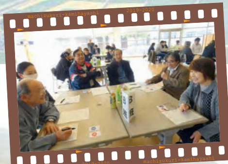
film04 砂山地域合同防災訓練研修 砂山小学校の多目的ホールで、砂山地域6集落合同で、カード型ゲーム「防災ゲームクロスロード」を実施。避難所で起きる様々な問題に頭をひねりながら考えに考え、ちよっぴり苦笑いでした。