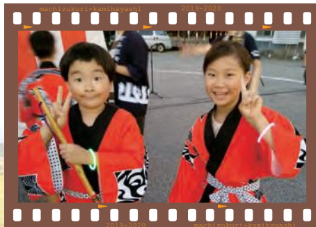
film09 やまゆり荘・やまやの里盆踊り 盆歌で笛を担当している子どもたち。始める前にカメラを向けると、二人とも満面の笑みでカメラに向かってピースサイン。この後、祭りの盛り上げ役として、篠笛の音色を奏でていました。