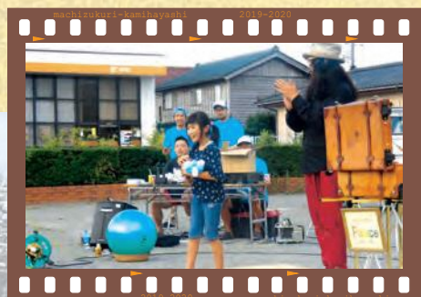
film07 西神納ふるさと夏祭り 今年のゲストにパフォーマーのピースさん。マジックの体験コーナーでは、来場した児童が体験。容器中の液体の色が変わるマジックを披露して、会場からは「オー!」の歓声が。体験した本人も「ビックリ」の笑顔でした。将来の夢は「マジシャン」に決定!?