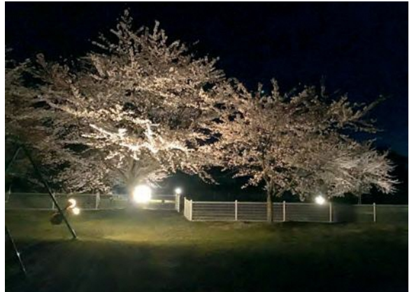
小出集落桜ライトアップ 期間：4月15日(月)～4月20日(土) 場所：小出集落公園

河内集落は、7月中旬から8月上旬までの間、日没からホタルが飛び交う様子を見ることができ、1年を通して楽しむことができる集落です。