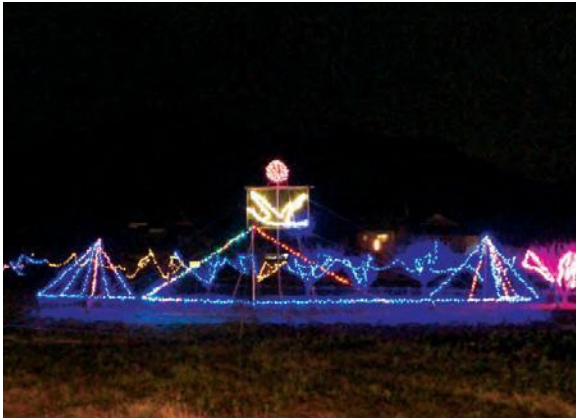
平林集落イルミネーション 期間：11月24日(日)～1月11日(土) 場所：平林集落農村公園

また、閉校記念事業実行委員会では4月から開校する新平林小学校でも、このイルミネーションを継続して活用してほしいと考えています。