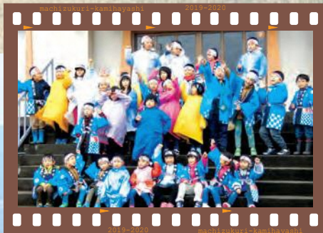
film02 平林保呂羽祭 4月15日、平林集落で平林保呂羽祭が行われました。日中は、子ども神輿が行われ、子どもたちの元気な声が集落内に響き渡ります。出発前に千眼寺での集合写真。「寒いけど、気合入れて頑張るぞお!」「おお〜!」。