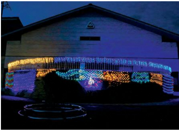
砂小閉校記念イルミネーション 期間：1月7日(火)～3月29日(日) 場所：砂小体育館屋外ステージ

令和2年3月で幕を閉じる砂山小学校に対し、これまでの62年間、ありがたい気持ちを込めて、体育館の屋外ステージに、イルミネーションが飾り付けられました。このイルミネーションは、地域の企業の方々の寄付、砂山地域まちづくり協議会、砂山小学校閉校記念事業実行委員会や地域の有志の方の協力により設置されました。午後4時から午後9時まで点灯しておりますので、ぜひお立ち寄りください。