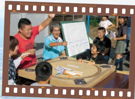
film06 桃川収穫感謝祭 地域おこし協力隊の臥牛山隊員を呼んで、紙相撲大会を開催!子供たちがこの日のために作った紙の力士を競わせ、盛り上がる姿に、行事を担当した集落の方もヒートアップ!集落全体で熱く盛り上がった一日となりました。