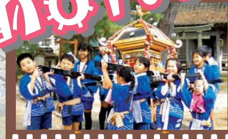
film03 塩谷大祭 9月20日は塩谷集落が一つになる日、「塩谷大祭」。子ども神輿は、塩竈神社を出発して、集落内を歩いて回ります。出発前にカメラを向けてみました。「やっぱり、重いかな!？」

まちづくり協議会のイベント開催時に撮られた「まちづくりベストショット」! みなさんは、どの「スマイル」がお好みですか!?