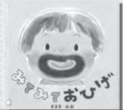
○みてみておひげ (たかみもも)