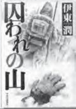
◆囚われの山 (伊東潤)