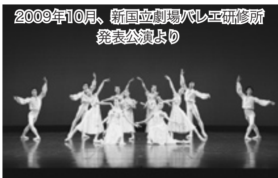
2009年10月、新国立劇場バレエ研修所 発表公演より