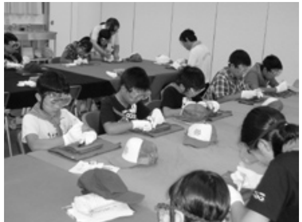
昨年の奥三面遺跡群資料の公開・活用事業（郷土の歴史学習・体験学習） 縄文の里・朝日で行った石器づくり体験