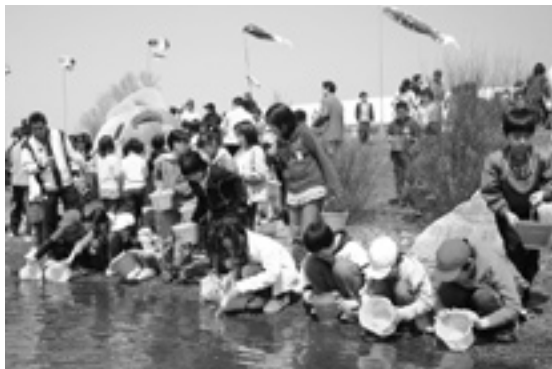
昨年の鮭増殖の稚魚導入事業(鮭稚魚放流式)の様子