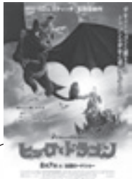
ヒックとドラゴン