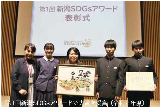
第1回新潟SDGsアワードで大賞を受賞（令和2年度）