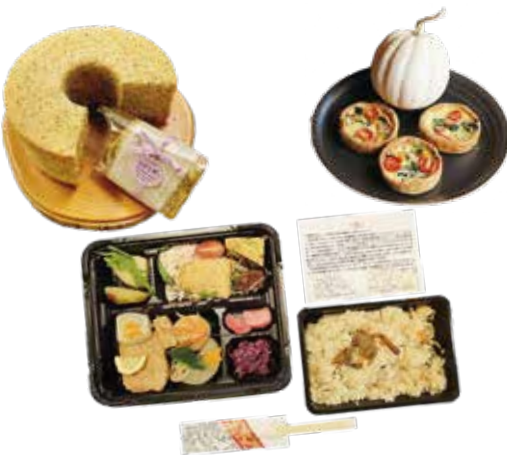
中学生の発案により作られたお弁当やスイーツ

平成30年から荒川中学校3年生によるSDGs×地域貢献活動がスタート。昨年度は、中学校3年生が考えた企画を地域事業者の前でプレゼンテーションし、生徒だけでは実現不可能な企画を地域事業者のサポートにより実現することができました。また、地産地消のお弁当やスイーツなどの販売などを通して、地域の魅力を広めることができました。この活動で得た売上金を村上市新型コロナウイルス対策応援基金へ寄附したほか、全校生徒から医療従事者への応援メッセージが書かれ