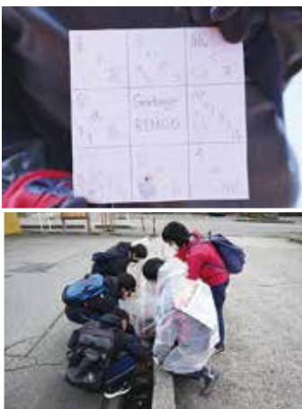
地元出身の大学生も参画。ゲーム感覚を取り入れたゴミ拾いをしました

中学生も大人も関係ない、一つの地域を想うチームの対等な仲間。若者の価値観も大切に取入れながら、互いに学び合い尊重し合うことで、若者が地域の最先端で挑戦できる土壌と雰囲気づくりをしています。