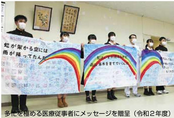
多忙を極める医療従事者にメッセージを贈呈（令和2年度）