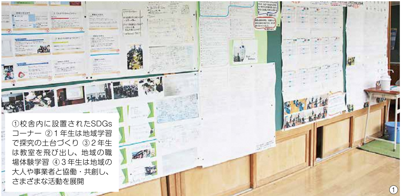
①校舎内に設置されたSDGsコーナー ②1年生は地域学習で探究の土台づくり ③2年生は教室を飛び出し、地域の職場体験学習 ④3年生は地域の大人や事業者と協働・共創し、さまざまな活動を展開