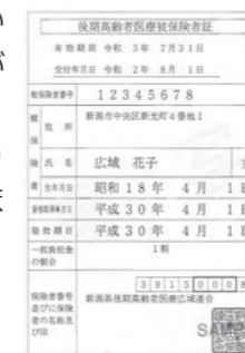
後期高齢者医療制度の新保険証は水色です