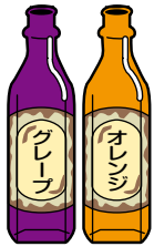
ジュース類のびん