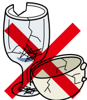
ガラス食器 ・せともの