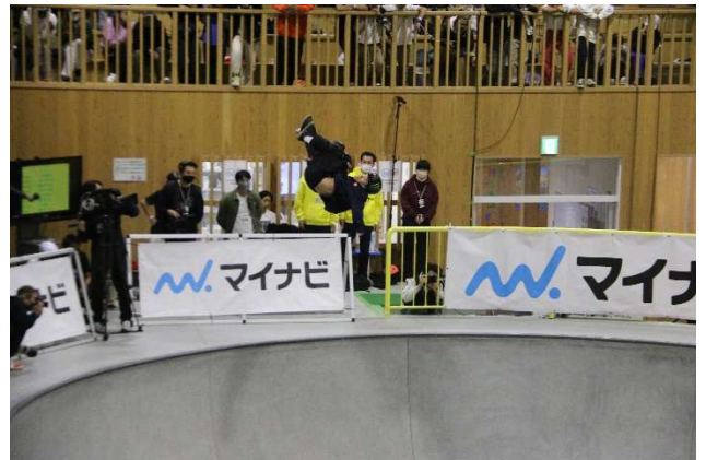
▲パーク競技決勝(平野歩夢選手)