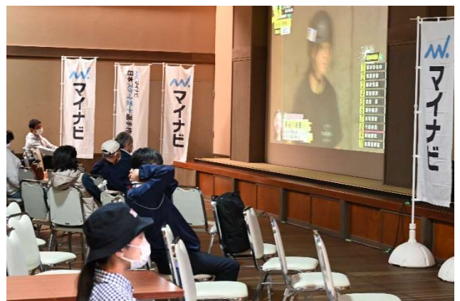
▲パブリックビューイング(瀬波温泉活性化施設)