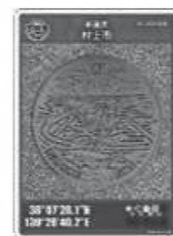
【荒川地域】 荒川地区公民館