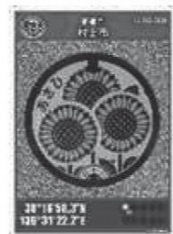
【朝日地域】 道の駅朝日 朝日みどりの里物産会館