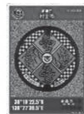
【神林地域】 道の駅神林 道路情報ターミナル