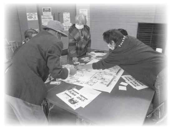
▲昨年度神林地域で実施した「老人クラブとのワークショップ」の様子

令和5年度 かみはやし互近所ささえ～る隊の活動 ①小中学生の子どもを持つ世代とワークショップの開催 ②「かみはやし♡ささえ愛♡の日」の啓発 ③ささえあいカレンダー Vol.5の作成および全戸配布 ④集落での実践のためのまちづくり協議会との連携