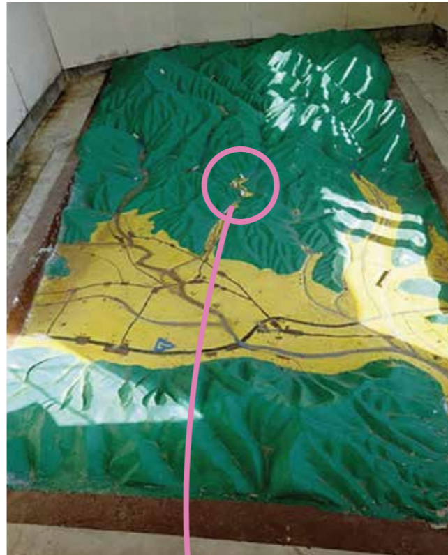
旧長津小学校の郷土模型 (パノラマ)