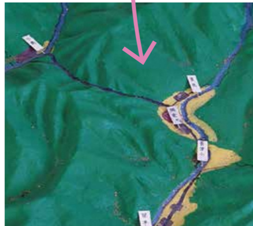
▲左上から小揚、釜杭、瑞雲、長津小、笹平

この郷土模型（パノラマ）は、昭和11年に7代目長津小学校の校長先生が、子供たちの協力を得ながら制作されたとのこと。効果をおける「パノラマ」子供たちが自分たちの住む地区を覚える為、校門脇にセメントで作った「パノラマ」が人気を集めていると、朝日新聞で取り上げられました。パノラマの上で、鶯ヶ巣や、三面川を飛び越えたとか遊んだ記憶が思い出されます。昭和55年に百周年記念事業で、後世に残すため、屋根を設置。平成12年は、小学校百二十周年事業として、パノラマの修復（塗装、集落の旗表示）を実施し、現在に至ります。地域の人達からは少し忘れかけられている存在なので、子供達を中心に地域で整備を進め、大切に守ってまいります。