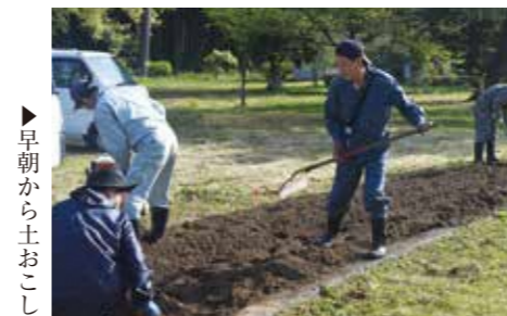
早朝から土おこし