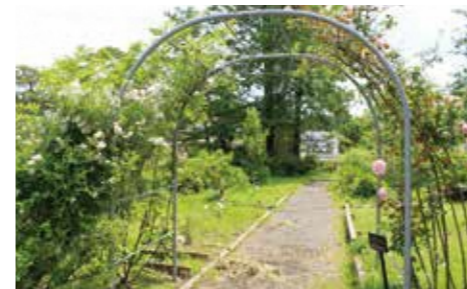
バラ園もあります