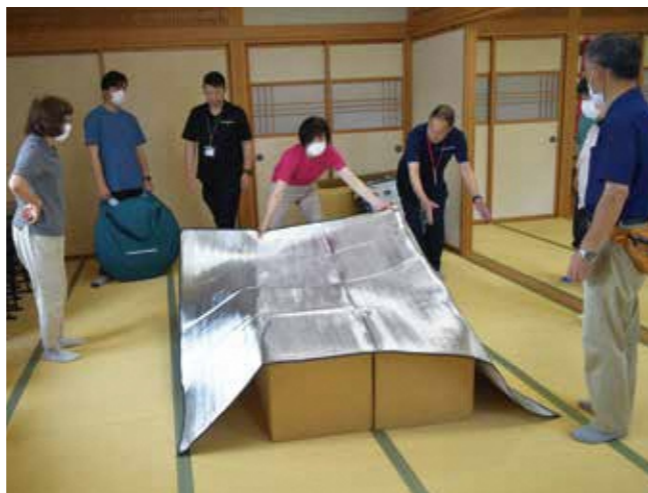
段ボールベッドの組み立て実演の様子