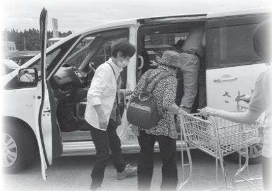
買い物支援の様子