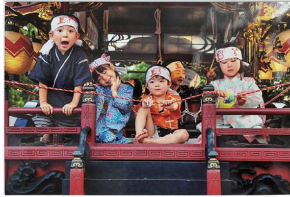
作品名「楽しい!嬉しい!」

問い合わせ 生涯学習課文化行政推進室（教育情報センター） ☎53-7511 記事ID 0079392