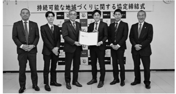
▲協力してゼロカーボンシティ実現を目指します！

この協定は、(同) DMM.com社と市がそれぞれの資源を活用してゼロカーボンシティの実現に向けて幅広く連携し、SDGsの掲げる持続可能な地域づくりを目指し協定を締結したもので、今後、市内公共施設などへのEV充電設備の設置を皮切りに、市が掲げる「ゼロカーボンシティの実現」に向けて、さまざまな事業で連携を進めます。