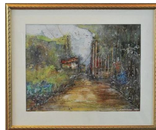
作品名「散歩のコース」

以前から受賞したいと思っていた賞で感激しています。先の見えない今日「道の先には明るさが見える」と信じながら描きました。作品には今まで描いた事のない「にじみ」や「飛ばし」の技術を使いました。あと何点描けるか分かりませんが、今年も挑戦したいと思っています。