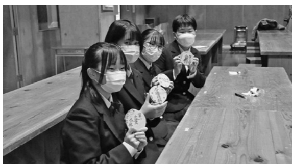
▲願いを書き込んだ絵馬を手に勝利を目指します！

ぬくもり工房の代表者から「頑張ってください」と声をかけられ、受け取った生徒たちは、受験や進路に向けての願いを「勝利の絵馬」に書き入れ、決意を新たにしていました。