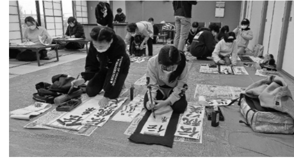
▲手本を見ながら練習に励む参加した皆さん

地域の小・中学生や地域の方など15人が、書き初めや筆字の練習のため参加しました。