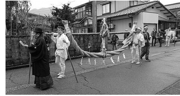
▲化粧をして、大きなしめ縄を担ぎ歩く主役たち

市無形民俗文化財に指定されている「塩野町オサトサマ」は、しめ縄を女性の神さまである山の神の花婿に見立て、山の神が合祀されている熊野神社へ婿入りの行列に模して奉納します。