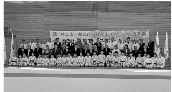
▲4年ぶりの開催で交流を深めました

村上市からは11人の選手団を含む総勢30人が参加して、久しぶりの交流を深めました。