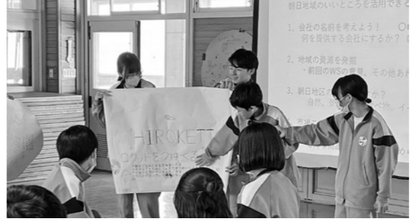
▲班ごとに考えたオリジナルの会社を発表し合う生徒たち

10年後の自分や朝日地域をイメージして、地域に必要な会社を班ごとに考えて発表するワークショップを実施しました。