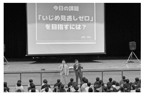
▲時おり笑い声も上がり、楽しい中で学びました

講演を聞いた子どもたちは、「相手の個性を受け止めて、尊重することが必要だと思いました」と話していました。