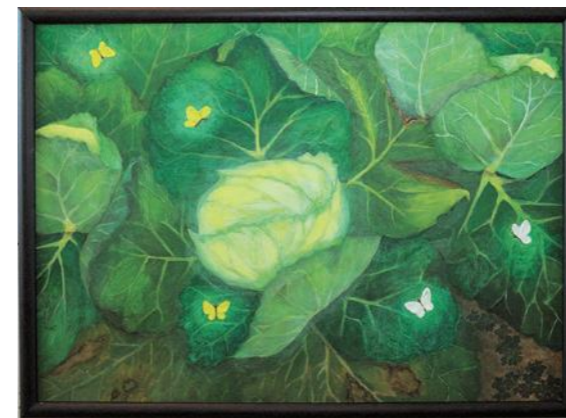
作品名「でっこなったネ」

このたびは、市展賞を頂きありがとうございます。書いていくと苦しみ、楽しさ、悩みなど思うようにならないこともありますが、長年続けてこれたのはご指導頂いた先生方、諸先輩、共に学んだ書友、書が続いていることを見守ってくれている家族、皆さまに心から感謝します。