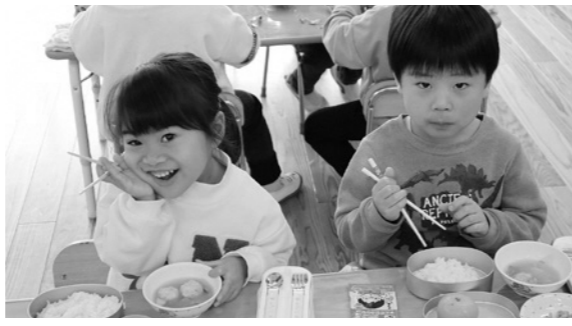
▲旬の鮭を使った鮭だんごを食べて、笑みがこぼれます