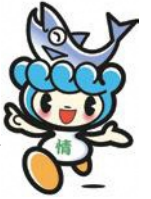
村上市観光キャラクター「サケリン」

障がい者手帳等をお持ちの方及び介護認定を受けている方の介添人(一人で乗降できないため介助が必要な場合のみ)は無料となります。