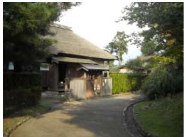
記念公園（まいづる公園）