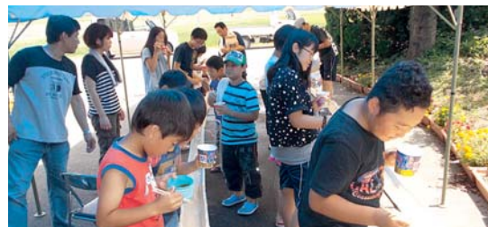
ふれあい事業 福田集落

牛屋の獅子踊りは、法徳寺の観音様祭り（8月17日）に奉納される三匹獅子舞です。今年も大勢の観衆の前で踊りが披露されました。