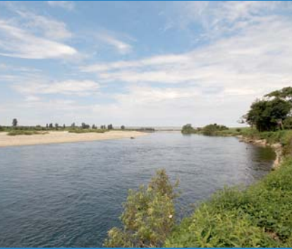
牛屋付近の清流荒川の流れ

砂山地域まちづくり協議会では、地域事業として「砂山地域」の皆さんが大事に思っている清流「荒川」と広大な「松林（お幕場）」をメインにした事業に取り組んでいます。また、集落の伝統を継承している事業や集落ぐるみのふれあい事業も応援しています。