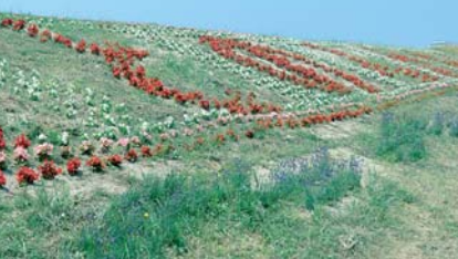
旭橋上流 福田付近に植栽した花絵文字

砂山地域の「松林（お幕場）」は、他の地域に誇れる広大な自然です。この松林を利用して「ワクワクお幕場ウォーキング」と題したイベントも行っています。