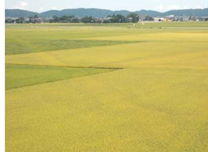
瑞穂大橋からの風景

地域全体では、夕涼み会のほか、ミニ体育祭や冬のイベントを予定しております。また、学校等と連携を図り、2年前より西神納小学校の文化祭にも参画しております。