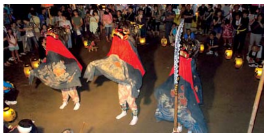
獅子踊り 牛屋集落

牛屋の獅子踊りは、法徳寺の観音様祭り（8月17日）に奉納される三匹獅子舞です。今年も大勢の観衆の前で踊りが披露されました。