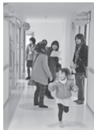
きれいな保育園がすっかり気に入ったようです