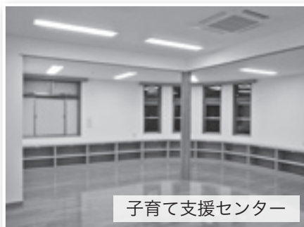
子育て支援センター