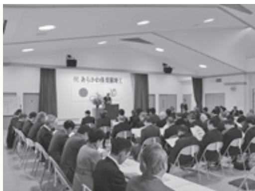
大勢の関係者らが集まった竣工式

公募した保育園名称の採用者となったお2人に記念品を贈呈しました。また、父母の会から感謝の言葉をいただくなど、保育園の新たな門出を祝いました。