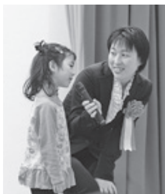
緊張したけど、しっかりとあいさつしました