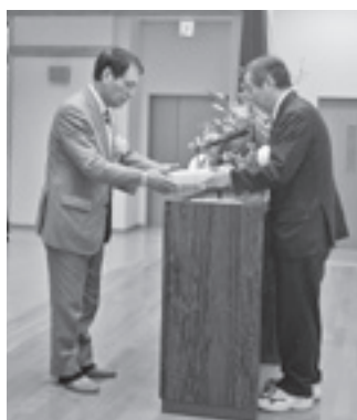
大滝市長より名称の採用者に記念品を贈呈