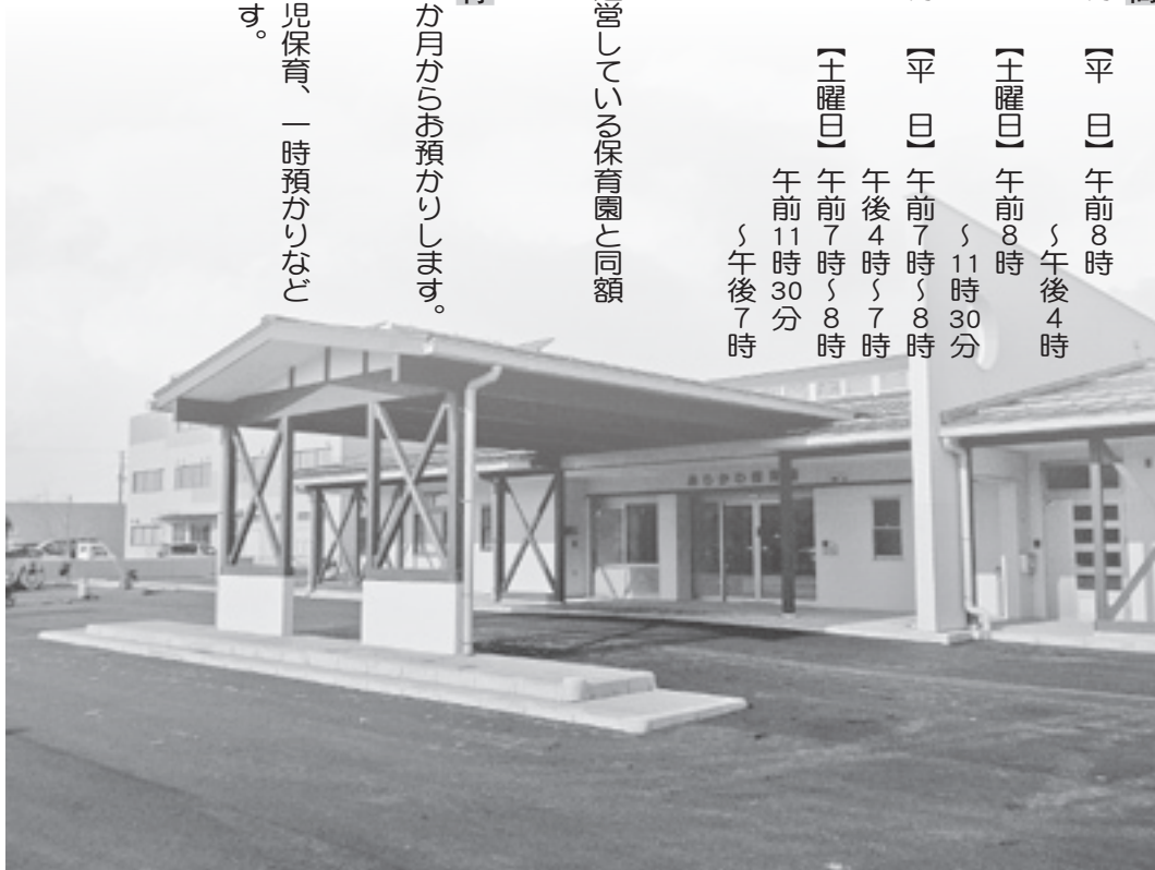
開園した保育園(玄関前)