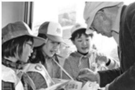
三面の森保全啓発事業