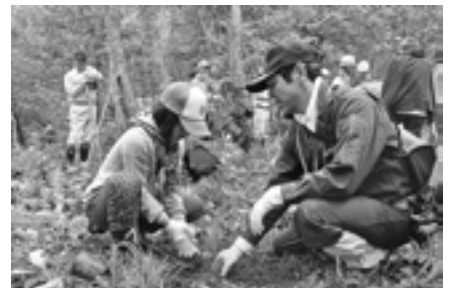
さけの森林づくり事業