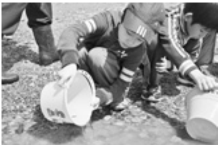
鮭増殖の稚魚導入事業