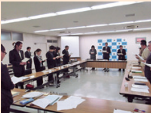
市議会や区長会などの各種会議、そして小・中学校の卒業式でも市民憲章が唱和されました。

私たちが思う「ふるさと村上」は一人ひとり違いますが、この市民憲章を通して思うふるさとの風景が「村上市」であれば、市民憲章そのものが私たちの目指す市民の一体感をつくることができるのではないか。この気づきが市民憲章づくりの原点となりました。