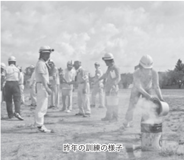
昨年の訓練の様子

●訓練は自主防災会(町内・集落)ごとに行います。 ●参加方法や時間、避難場所などは、各自主防災会 にご確認ください。