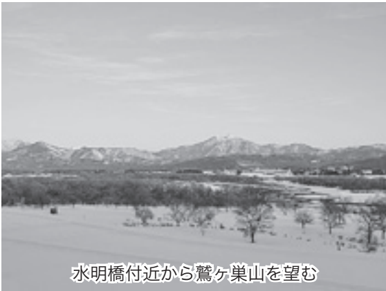
水明橋付近から鷲ヶ巣山を望む

新しい市民憲章は、前文と唱和文が共にあることで成り立っています。前文を聞きながら目を閉じるとそれぞれのふるさとが浮かび上がり、唱和文を口にするこゝとで新しい村上市が見えてくる構成としています。前文は唱和文に奥行きを与え、イメージを膨らませてくれています。ぜひ、機会がある度に言葉に出して読んでいただいたり、心でつぶやいたりしてください。この市民憲章が、皆さんの心にいっまでも寄り添う「ふるさとの言葉」になることを願っています。