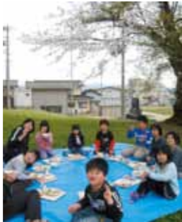
三年生一人一人が教室でお盆を桜の木の下まで持って行って、お花見給食がスタートです。三階テラスでは、四・五・六年生の三学年が一緒に車座になって食べました。

上野集落の花見は毎年4月後半の日曜日に実施しています。午前中に水路補修、道路清掃等の共同作業を行い、作業終了後に慰労会を兼ねて集落センターで花見を実施します。今年は4月29日に実施しました。晴天の下、午前中は作業で汗を流し、午後は待望の花見(花より団子?ステージに飾られた花瓶の桜を眺めながら)となりました。「いい仕事をした後ビールはうまいなあ」と飲んで食べて和気あいあい。大いに盛り上がりました。(上野 志田 義栄)